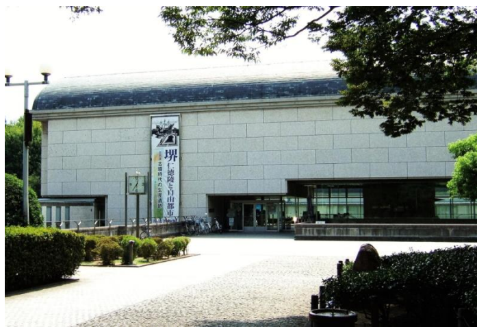
堺の歴史と文化の殿堂 堺市博物館