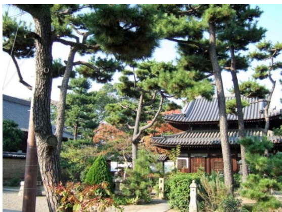
茶の湯の文化の殿堂 南宗寺