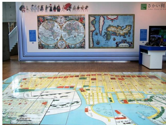
新しい堺文化の殿堂 さかい利晶の杜 玄関ホール